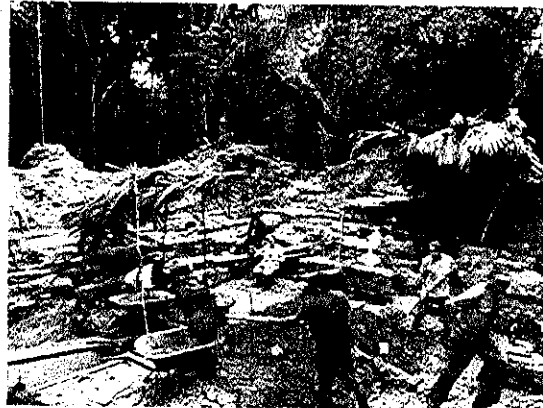
Investigando patio central